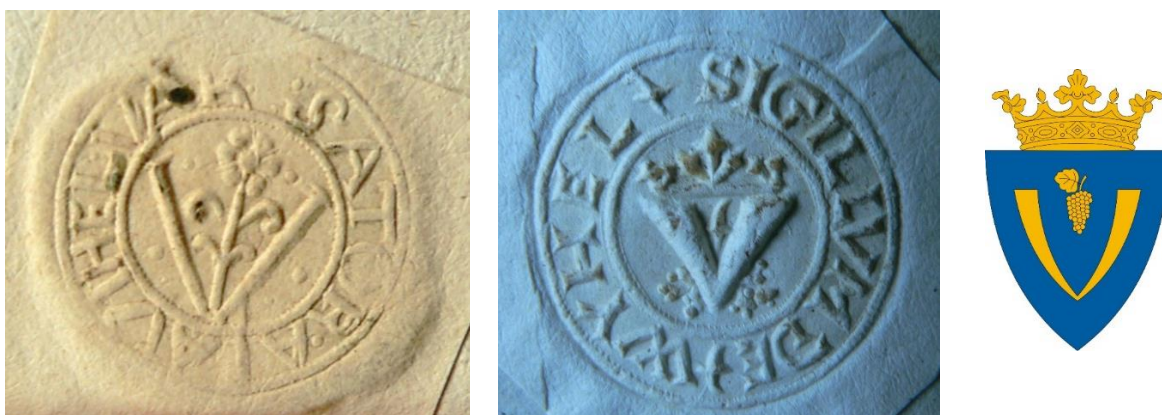
7–8–9. ábra: A város címere 1721. és 1800. évi iraton (MNL OL E 213. 235.; BAZML SFL V. 1. 1–64.; T. I. felv.) és Sátoraljaújhely mai címere

Nem szerepelt azonban a város pecsétjén egyik megszokott motívum sem. A város eredetileg a korai alapítású királyi városok mintájára egyszerűen az Árpádok vágásos címerét használta némi egyéb motívummal kiegészítve. Esztergom, Buda, Eperjes, Besztercebánya – a hosszú sorból csak néhány királyi várost emeltem ki –, pecsétjein, Újhelyhez hasonlóan, a dinasztia címere látszott. I. Károly a 14. század elején egy rövid időre a Babonics családnak adományozta a pataki uradalmat, vele együtt Újhelyt is, a város pedig így módon elveszítette a királyi címer viselésének jogát. Ekkor történt, hogy egy ügyetlen kéz belevéselt az addigi pecsétnyomó vágásos címerének közepébe. Egy furcsa, kerekített V betű forma jött létre, amely megegyezett a város latin írástípus szerinti kezdőbetűjével, a 'V' betűvel. A latin szövegekben a magyar Újhely szót ugyanis a Vihel írásképpel adták vissza.