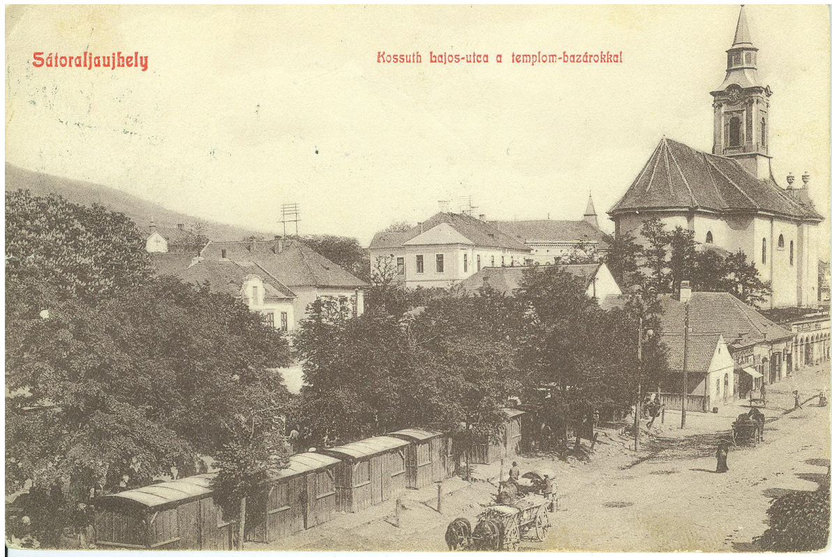
2. ábra: A sátoraljaújhelyi plébániatemplom képeslapon, 1908

1261-ben húzták fel a város első házait is. Az alapítás évében még sem ezek, sem a vár nem volt kész. Erről a szokatlanul bőbeszédű városi alapítólevél számol be. 11 A városba nem vallonokat telepítettek, nem is az ekkor szokásos délnémet telepesek érkeztek ide, hanem magyarok és szlávok alkották a lakosságát. Hogy milyen arányban azt sohasem fogjuk megtudni. A 15. századra azonban kétségtelenül tiszta magyar város áll előttünk. Az új város papja plébánosi rangot kapott, és egy jó évszázad múlva már az újhelyi plébánia éppúgy kiváltságolt plébánia volt, mint a pataki, és maradt is egészen a reformációig. A kiváltságok azonban csak Egerrel szemben érvényesültek, a pataki plébános ugyanis mindvégig fenntartotta Újhely fölött több jogát.