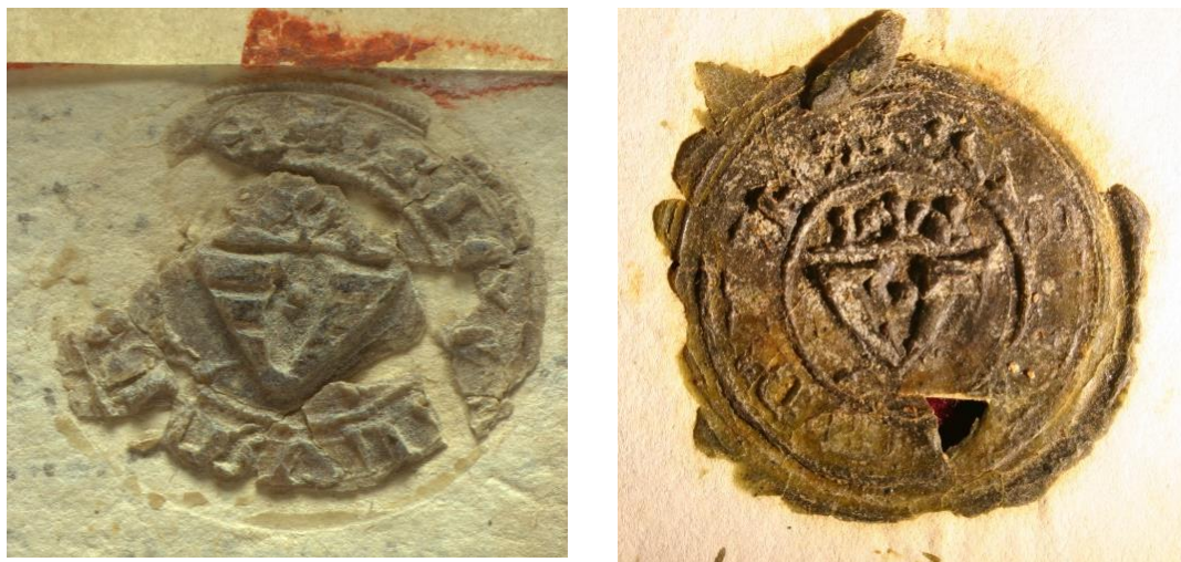
5–6. ábra: A város pecsétje egy 1354. évi és egy 1513. évi oklevélen (MNL OL DI 4430; MNL dig. felv. és Bártfa város levéltára, Bártfa/Bardejov, Szlovákia, № 4398; Štefan Péchy felv.)

A védőszent jóval többet jelentett egy középkori településen a templomok titulusanál. A védőszent ünnepe egyben a földesúri adófizetés egyik napja is volt, és általában erre kérték az éves vásárok engedélyét. A magyar városi pecsétek két fő motívuma vagy a városfal és a városkapu, vagy a védőszent ábrázolása volt. E jelenségek egy része itt is megfigyelhető. Az újhelyi vendégek – ez volt a település lakóinak korabeli elnevezése – eredetileg évente egyszer fizettek földbért a hercegnek, mégpedig Szent István napján, azaz nem Szent Imre ünnepén, hanem a város alapítójának védőszentje napján. A város évszázadokon keresztül fontos kereskedelmi központ volt. A település a középkor végére négy éves vásáradományt nyert. Virágvasárnap, Szent Imre, Szent Egyed és Sarlós Boldogasszony napján, illetve az ezeket követő néhány napon rendeztek sokadalmat Sátoraljaújhelyen. Virágvasárnap a húsvéti ünnepkör része, és mint ilyen mozgó ünnep, ezért ezzel most nem foglalkozunk. A Szent Imre-napi vásárt a plébánia, az Egyed-napit pedig a pálos kolostor védőszentjének ünnepére tették.