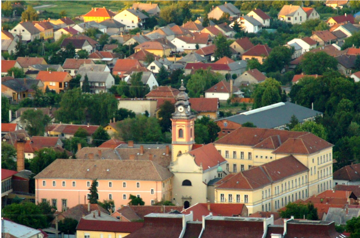
3. ábra: Az egykori pálos kolostor és rendház 2011-ben len

A 12–13. századi városiasodás egyik jellegzetessége volt a városi szerzetesrendházak építése. Az ekkor alakuló új szerzetesrendek jelentős része a városok társadalmához kapcsolódott, a szerzetesek élete sok szállal kötődött a városlakókéhoz. Különösen igaz volt ez a négy koldulórendre, a ferencesekre, a domonkosokra, a karmelitákra és az ágostonos remetékre. Az utóbbi hivatalos neve remetékre utalt ugyan, valójában azonban koldulórend volt. A koldulórendek és a városok kapcsolata mára már a történettudomány közismert megállapításai közé tartozik. Valamelyik koldulórend megtelepedését egy helységben a városiasodottság egyik fokmérőjének tekintjük. 13